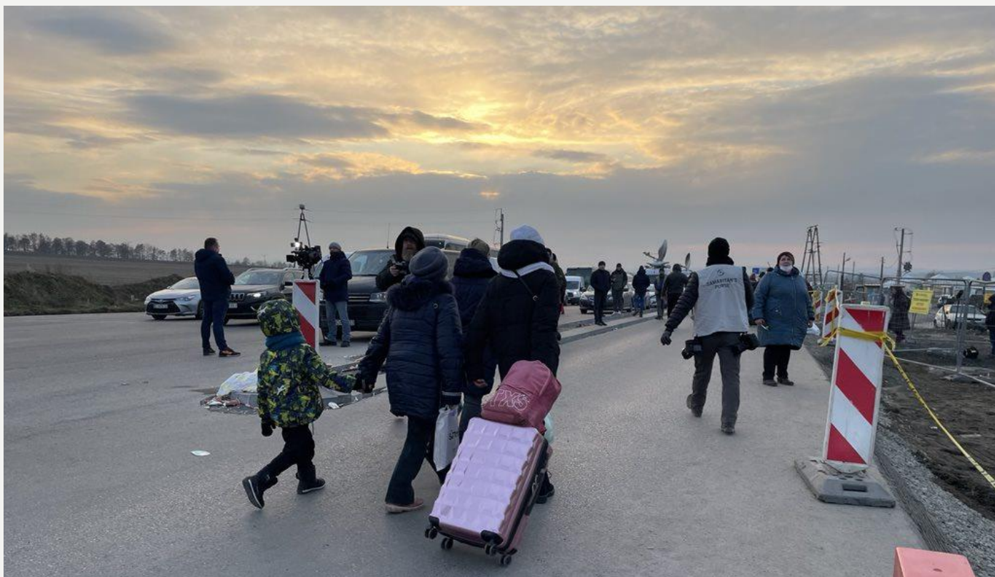
Польша, март 2022 г.

4. Расширение масштабов гуманитарной помощи пострадавшему населению Украины. Помощь тем, кто не может или предпочитает не уезжать по любой причине – включая, но не ограничиваясь возрастом/полом/составом семьи/средствами или возможностями – является критически важной.