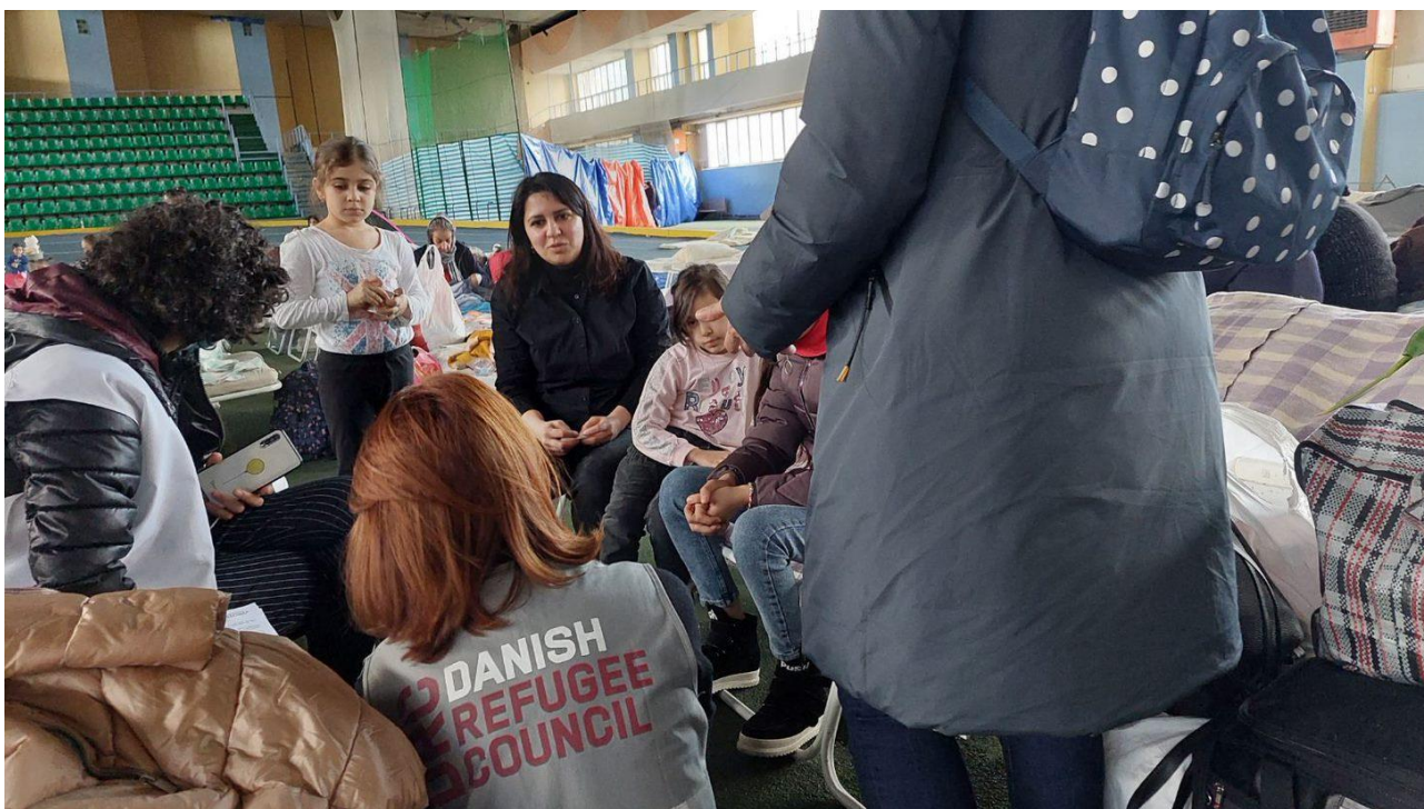
Фото: DRC, Молдова – Кишинев, март 2022 г.

Учитывая датские корни DRC, организация представляет гражданское общество и уполномочена помогать беженцам, имея определенную роль в процедуре предоставления убежища и работе по интеграции беженцев в Дании. Поэтому DRC взаимодействует с украинской диаспорой, сетью из более чем 6 000 волонтеров, иммиграционными властями и муниципалитетами, чтобы определить потребность в помощи и предоставить прямую поддержку, включая юридическую помощь, тем жителям Украины, которые уже прибыли в Данию, а также подготовиться к прибытию новых беженцев.