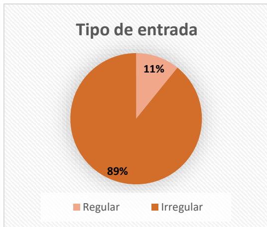
Ilustración 1. Tipo de entradas, intención de permanencia. Fuente: Monitoreo de Protección, DRC-Encuentros. Diciembre 2023 a febrero de 2024.

Durante el periodo diciembre de 2023 a febrero de 2024, el 89,2% de las familias monitoreadas reportaron que han ingresado a Perú de manera irregular. De este grupo el 91% indicó que su intención principal es permanecer en el país mientras que el 1.8% señala que se encuentra en situación de tránsito hacia otro lugar.