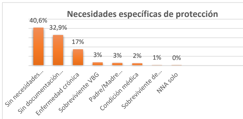
Ilustración 3. Personas con necesidades específicas.

Por otro lado, cuando se consulta por las necesidades específicas de protección, el 40.6% de las familias señalaron que no tienen las necesidades básicas cubiertas, el 32,9% reportaron necesidad de documentación y el 17,3% presentan una enfermedad crónica; esta última categoría presenta un aumento del 6% con respecto al bimestre anterior.